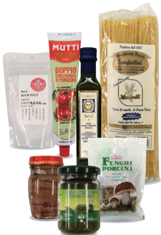
ナショナル麻布セレクション イタリアングルメセット B