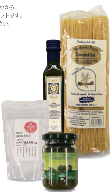
ナショナル麻布セレクション イタリアングルメセット A